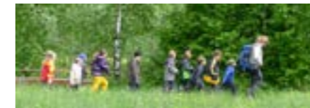
Alle Altersstufen, ganzjährig