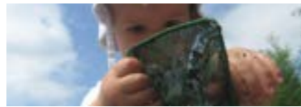
Kindergarten, Primarschule, April bis Oktober