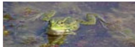
Kindergarten, Primarschule, April bis Oktober