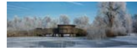
Alle Altersstufen, Winter