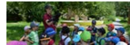
Alle Altersstufen, April bis Oktober