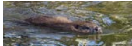
Kindergarten, Primarschule, ganzjährig