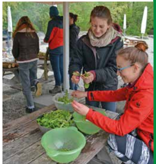
Saisonal und kunterbunt (oben) Apéro im Grünen (links) Team-Workshop (rechts)