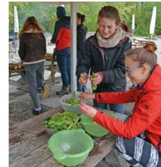
Saisonal und kunterbunt (oben) Apéro im Grünen (links) Team-Workshop (rechts)